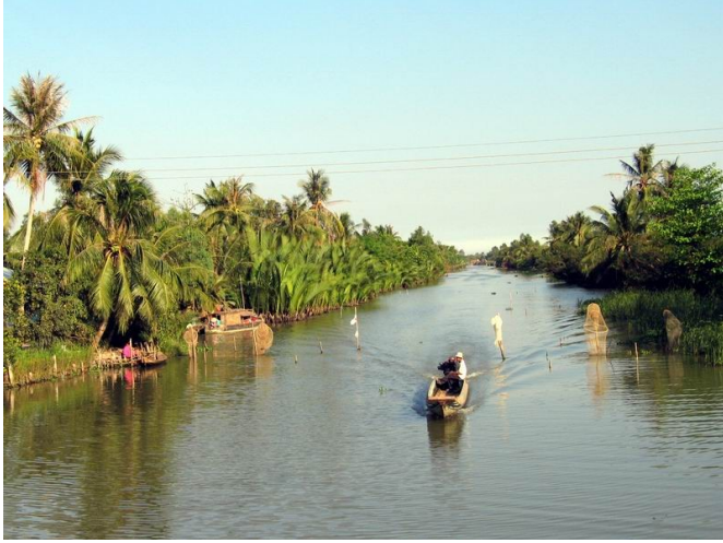
ទិដ្ឋភាពទឹកដីកម្ពុជាក្រោម

គ្រប់កាលៈទេសៈ គឺជាបងប្អូននៅខាងក្រៅមិនដែលបំភ្លេច មិនដែលលះបង់បងប្អូនដែលនៅក្នុងស្រុកនោះទេបាទ! សូមផ្តាំធ្វើបុណ្យឲ្យបាន! សូមកុំឲ្យអស់សង្ឃឹមឲ្យសោះបាទ! ”។ លោកថាថ្ម ឆ្អឹងថាថ្ម ប្រធានប្រតិបត្តិសហព័ន្ធខ្មែរកម្ពុជាក្រោម ដែលជាអធិបតីនៅក្នុងកម្មវិធីនេះបានថ្លែង រៀបរាប់អំពីគោលការណ៍របស់សហព័ន្ធយ៉ាងដូច្នោះ “សហព័ន្ធខ្មែរកម្ពុជាក្រោម ទោះបីតស៊ូនៅលើទឹកដីកម្ពុជាក្រោមក៏ដោយ តស៊ូនៅខាងក្រៅក៏ដោយ ក៏ពួកខ្ញុំហ្នឹងជាខ្មែរដែរ ពិសេស យើងមានភារកិច្ចដាស់តឿនខ្មែរយើងទាំងអស់គ្នា ព្រោះខ្ញុំចង់មានជំនឿថា សហព័ន្ធខ្មែរកម្ពុជាក្រោម ដែលធ្វើសព្វថ្ងៃហ្នឹងមិនមែនធ្វើដើម្បីបង្កើតក្រុមគណបក្សទេ គឺធ្វើដើម្បីការពារប្រទេសជាតិ ដើម្បីការពារខ្មែរ ដើម្បីការពារបូរណភាពទឹកដីយើង ទាំងទឹកដីបច្ចុប្បន្ន ទាំងទឹកដីដែលបាត់បង់ទៅហើយ អញ្ចឹងមិនថាបាត់បង់១០០-២០០ឆ្នាំនោះទេ អ្វីក៏ដោយបាត់បង់ក៏នៅជាទ្រព្យសម្បត្តិរបស់យើង ត្រឡប់មក