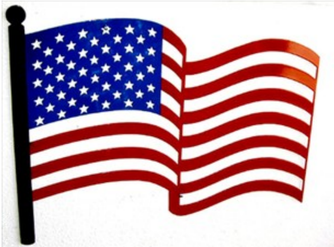
ទង់ជាតិសហរដ្ឋអាមេរិក

សឹងតែមួយសប្តាហ៍កន្លងមកហើយ អ្នកដែលរស់នៅលើទឹកដីនៃសហរដ្ឋអាមេរិក បានឮសូរសម្តែងផ្ទះ ពីទីនេះម្តង ពីទីនោះម្តង ទាំងថ្ងៃយប់។ នោះមិនមែនជាសូរកាំភ្លើង ដោយសារអសន្តិសុខ ដោយប្រការណាមួយទេ ប៉ុន្តែគឺសូរជាន់តូចធំ ដែលអ្នកស្រុកអុជ ដើម្បីអបអរសាទរចំពោះថ្ងៃបុណ្យឯករាជ្យ នៃសហរដ្ឋអាមេរិក។ ជាប្រពៃណី ជនជាតិអាមេរិកាំងតែងប្រារព្ធពិធីនេះជារៀងរាល់ឆ្នាំ នៅថ្ងៃទី៤ ខែកក្កដា ជាថ្ងៃដែលសហរដ្ឋអាមេរិក បានប្រកាសឯករាជ្យពីចក្រភពអង់គ្លេស។ ស្មារតីស្នេហាជាតិ មាតុភូមិ បានត្រូវបង្ហាញឡើង ដោយការដោតទង់ជាតិសហរដ្ឋអាមេរិក ស្ទើរតែគ្រប់មុខផ្ទះ និងនៅតាមគ្រឹះស្ថានសាធារណៈ។ ហើយពិធីអបអរសាទរក៏ត្រូវបានរៀបចំឡើងទូទៅ ទាំងជាន់ខ្ពស់ និងជាន់ប្រក្រតី។ ពិធីអបអរសាទរនេះ មានឫសគល់យ៉ាងជ្រៅ ទៅក្នុងប្រពៃណីអាមេរិកាំងអំពីសេរីភាព នយោបាយ។