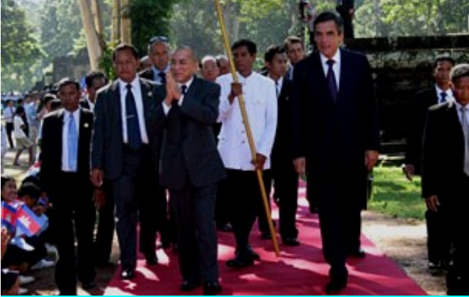
ព្រះមហាក្សត្រខ្មែរ ព្រះបាទ នរោត្តម សីហមុនី ជូនមុខធ្មេង និងនាយករដ្ឋមន្ត្រីនៃសាធារណរដ្ឋបារាំង លោក ហ្វ្រង់ស្វ័រ ហ្វីល័ន (Francois Fillon) [មុខ ស្តាំ] ក្នុងពិធីបិទការដ្ឋានជួសជុលប្រាសាទបាពួន នៅខេត្តសៀមរាប កាលពីថ្ងៃទី៣ កក្កដា ឆ្នាំ២០១១ ។

ព្រះមហាក្សត្រខ្មែរ បានអំពាវនាវចំពោះរដ្ឋាភិបាលនៃសាធារណរដ្ឋបារាំង និងរដ្ឋាភិបាលនៃប្រទេសជាមិត្តនានាក្នុងពិភពលោក សូមឱ្យបន្តជួយឧបត្ថម្ភជាថវិកា និងបច្ចេកទេសទៅទៀត ដើម្បីរៀបចំ និងជួសជុលរមណីយដ្ឋានប្រាសាទបូរាណខ្មែរដែលកំពុងទទួលរងការបាក់បែក ឱ្យល្អឡើងវិញ។