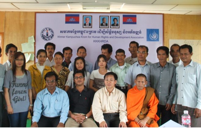
ក្រុមសិក្ខាកាម និងគ្រូបណ្តុះបណ្តាលច្បាប់ នៃសមាគម ខ្មែរកម្ពុជាក្រោម ដើម្បីសិទ្ធិមនុស្ស និងអភិវឌ្ឍន៍

សមាគមខ្មែរកម្ពុជាក្រោម ដើម្បីសិទ្ធិ មនុស្ស និងអភិវឌ្ឍន៍ ហៅកាត់ថា KKKHRDA ដែលមានទីស្នាក់ការ បិតនៅក្នុងសហគមន៍បុរី ព្រៃនគរ ភូមិគោកឃ្លាង សង្កាត់ភ្នំពេញថ្មី ខណ្ឌ សែនសុខ រាជធានីភ្នំពេញ បានបើកសិក្ខា សាលាមួយមានរយៈពេលពីរថ្ងៃ គឺចាប់ពីថ្ងៃទី ២៩ ដល់ថ្ងៃទី៣០ ខែមិថុនា ឆ្នាំ២០១១ ដោយ សិក្សាទៅលើ ក្រមព្រហ្មទណ្ឌ ក្រមនីតិវិធីព្រហ្ម ទណ្ឌ ច្បាប់ភូមិបាល និងច្បាប់សញ្ញាតិ នៃព្រះ