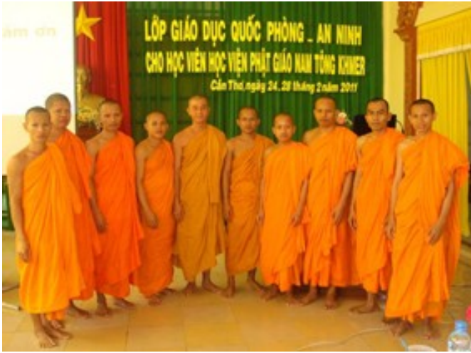
រូបថតអនុស្សារវីរ័យ វត្តបណ្តុះបណ្តាលការពារជាតិ សន្តិសុខ ដល់សមណសិស្សនៅវិទ្យាស្ថានព្រះពុទ្ធសាសនាខ្មែរថេរវាទ នៅទីក្រុងព្រៃកប្បសិរ

អាជ្ញាធរយួនខេត្តឃ្លាំង បានកោះហៅព្រះសង្ឃ និងគណៈកម្មការអាចារ្យវត្តមួយ ចំនួនទៅសិក្សាអប់រំ អំពីទ្រឹស្តីកុម្មុយនិស្តរបស់ពួកគេ ដោយពួកគេបានមកបញ្ជោត សម្ពុត គំរាម កំហែង ដល់ព្រះសង្ឃ និងគណៈកម្មការអាចារ្យវត្តកុំឲ្យជឿពាក្យសម្តីរបស់បុគ្គល អង្គការសមាគមទាំងឡាយ ដែលនៅក្រៅប្រទេស។ យ៉ាងនេះក្តី ព្រះសង្ឃ និងគណៈកម្មការអាចារ្យវត្ត បានឲ្យដឹងថា ការហាមប្រាមរបស់ពួកគេ ដូច្នោះ ព្រោះតែពួកគេខ្លាចអ្នកនៅខាងក្រៅស្រុក បរិហារកេរ្តិ៍ឈ្មោះ និងអំពើមិនល្អរបស់ពួកគេ ដែលប្រព្រឹត្តមកលើពលរដ្ឋខ្មែរក្រោម។ បុរសខ្មែរក្រោមម្នាក់ សូមមិនបញ្ចេញឈ្មោះបានឲ្យដឹងពីទឹកដីខេត្តព្រះត្រពាំងមកថា វត្តបណ្តុះបណ្តាលដែលអាជ្ញាធរយួនបង្ខំឲ្យព្រះសង្ឃ និងគណៈកម្មការ អាចារ្យតាមបណ្តាវត្តទៅរៀននោះ គឺគេនិយាយអំពីការរក្សាសន្តិសុខ