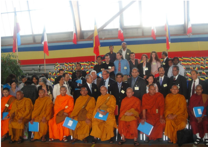
ថ្នាក់ដឹកនាំ និងព្រះសង្ឃ នៃសហព័ន្ធខ្មែរកម្ពុជាក្រោម ក្នុងពិធីរើកខ្លបទិវាបារាំងកាត់ទឹកដីកម្ពុជាក្រោមឱ្យយួន នៅសាធារណរដ្ឋបារាំង

ថ្ងៃទី០៤ ខែមិថុនា គឺជាខួបទី៦២ឆ្នាំ ដែលព្រះរាជាណាចក្រកម្ពុជា បាត់បង់ទឹកដីខ្មែរ ក្រោមទៅឲ្យរៀនណាម។ សហព័ន្ធខ្មែរកម្ពុជា ក្រោម បានរៀបចំពិធីរើកខ្លបនេះហូរហែ ជា រៀងរាល់ឆ្នាំ ដូចជានៅសហរដ្ឋអាមេរិក កាណា ដា ស្វីស បារាំង និងនៅតាមបណ្តាប្រទេសនានា